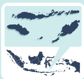
Gambar 1. Data Administratif Utama

utamanya adalah pengelolaan keuangan yang efisien untuk pemenuhan layanan dasar yang inklusif bagi semua warga. Pemerintah juga memprioritaskan kesetaraan gender, hak disabilitas, dan inklusi sosial (GEDSI) dalam dokumen kebijakan utama. Kolaborasi antara pemerintah daerah, masyarakat sipil, dan organisasi non-pemerintah dilakukan untuk memperkuat pengelolaan keuangan publik, meningkatkan pemanfaatan data untuk perencanaan, dan mendorong keterlibatan masyarakat. Program SKALA 1 bekerja sama dengan Pemerintah Provinsi NTT untuk memperkuat partisipasi kelompok rentan dalam perencanaan pembangunan, memperkuat pemanfaatan data dan analisis yang handal, meningkatkan kapasitas keuangan daerah, dan memperkuat kualitas belanja publik. Kantor SKALA di NTT mulai beroperasi pada Mei 2023, menandai kemajuan signifikan dalam kolaborasi dan pengembangan daerah.